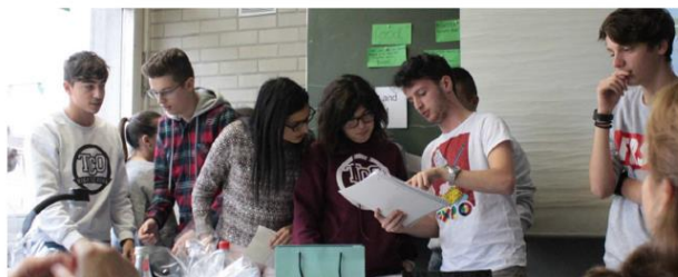
Laboratori - Team - Progettualità - Strategie

Giurisprudenza Architettura Ingegneria Lavoro Farmacia Chirurgia Carriera militare ALTRO University Medicina INFORMATICA FISICA Scienze matematiche RADIO Economia Lingue e Letterature Straniere Scienze Politiche